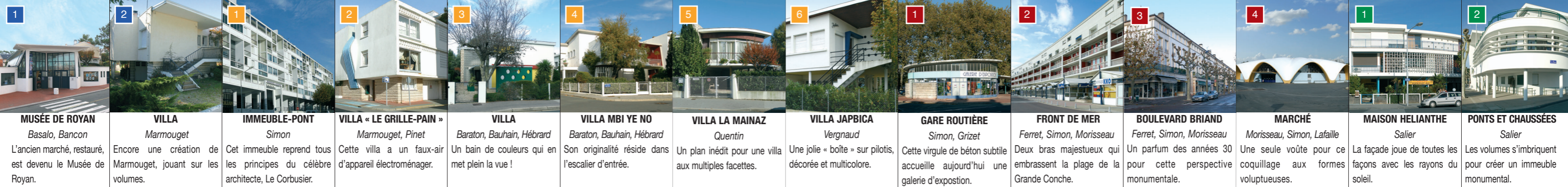
MUSÉE DE ROYAN Basalo, Bancon L'ancien marché, restauré, est devenu le Musée de Royan. VILLA Marmouget Encore une création de Marmouget, jouant sur les volumes. IMMEUBLE-PONT Simon Cet immeuble reprend tous les principes du célèbre architecte, Le Corbusier. VILLA « LE GRILLE-PAIN » Marmouget, Pinet Cette villa a un faux-air d'appareil électroménager. VILLA Baraton, Bauhain, Hébrard Un bain de couleurs qui en met plein la vue ! VILLA MBI YE NO Baraton, Bauhain, Hébrard Son originalité réside dans l'escalier d'entrée. VILLA LA MAINAZ Quentin Un plan inédit pour une villa aux multiples facettes. VILLA JAPBIGA Vergnaud Une jolie « boîte » sur pilotis, décorée et multicolore. GARE ROUTIÈRE Simon, Grizet Cette virgule de béton subtile accueille aujourd'hui une galerie d'exposition. FRONT DE MER Ferret, Simon, Morisseau Deux bras majestueux qui embrassent la plage de la Grande Conche. BOULEVARD BRIAND Ferret, Simon, Morisseau Un parfum des années 30 pour cette perspective monumentale. MARCHÉ Morisseau, Simon, Lafaille Une seule voûte pour ce coquillage aux formes voluptueuses. MAISON HELIANTHE Salier La façade joue de toutes les façons avec les rayons du soleil. PONTS ET CHAUSSÉES Salier Les volumes s'imbriquent pour créer un immeuble monumental.